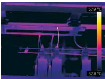
Transformateur de circuit électrique chaud